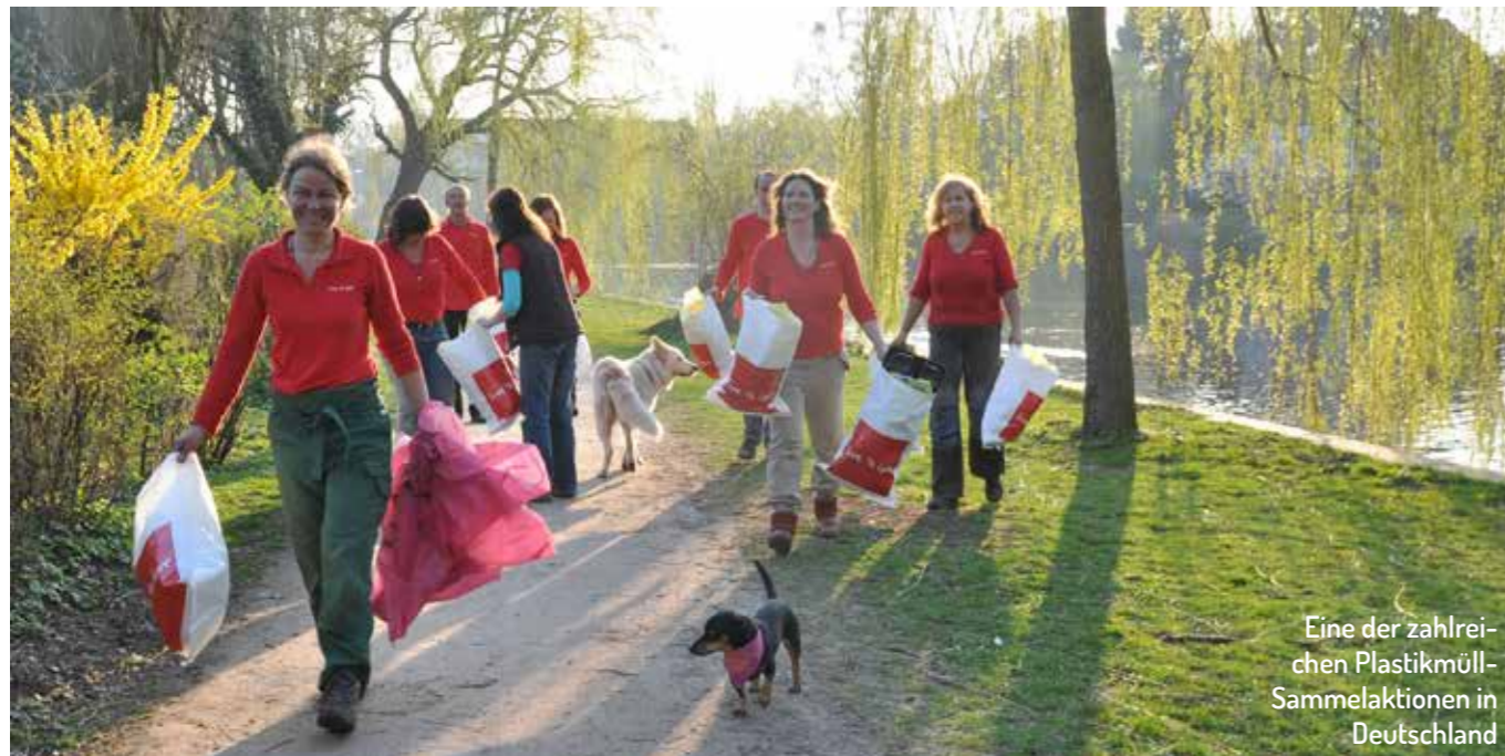
Eine der zahlrei- chen Plastikmüll- Sammelaktionen in Deutschland