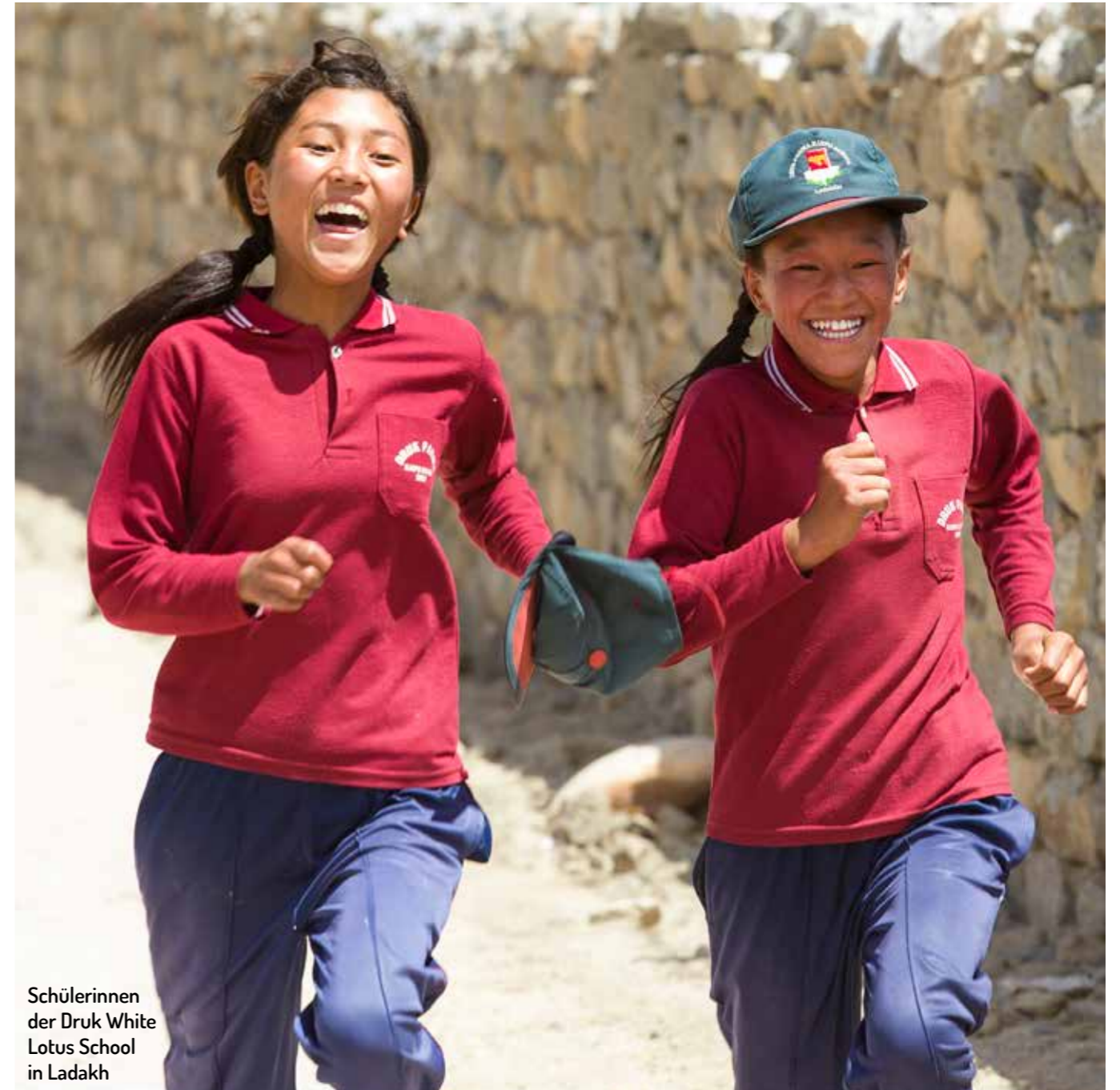
Schülerinnen der Druk White Lotus School in Ladakh

Gebt Frauen und Mädchen überall auf der Welt die Chance auf Gleichberechtigung. Setzt Euch für den Schutz unterdrückter Mädchen und Frauen ein. Unterstützt die Bildung junger Mädchen. Gebt Frauen Mikrokredite.