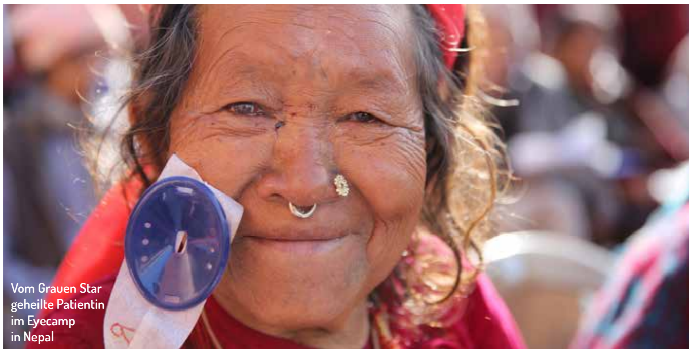
Vom Grauen Star geheilte Patientin im Eyecamp in Nepal