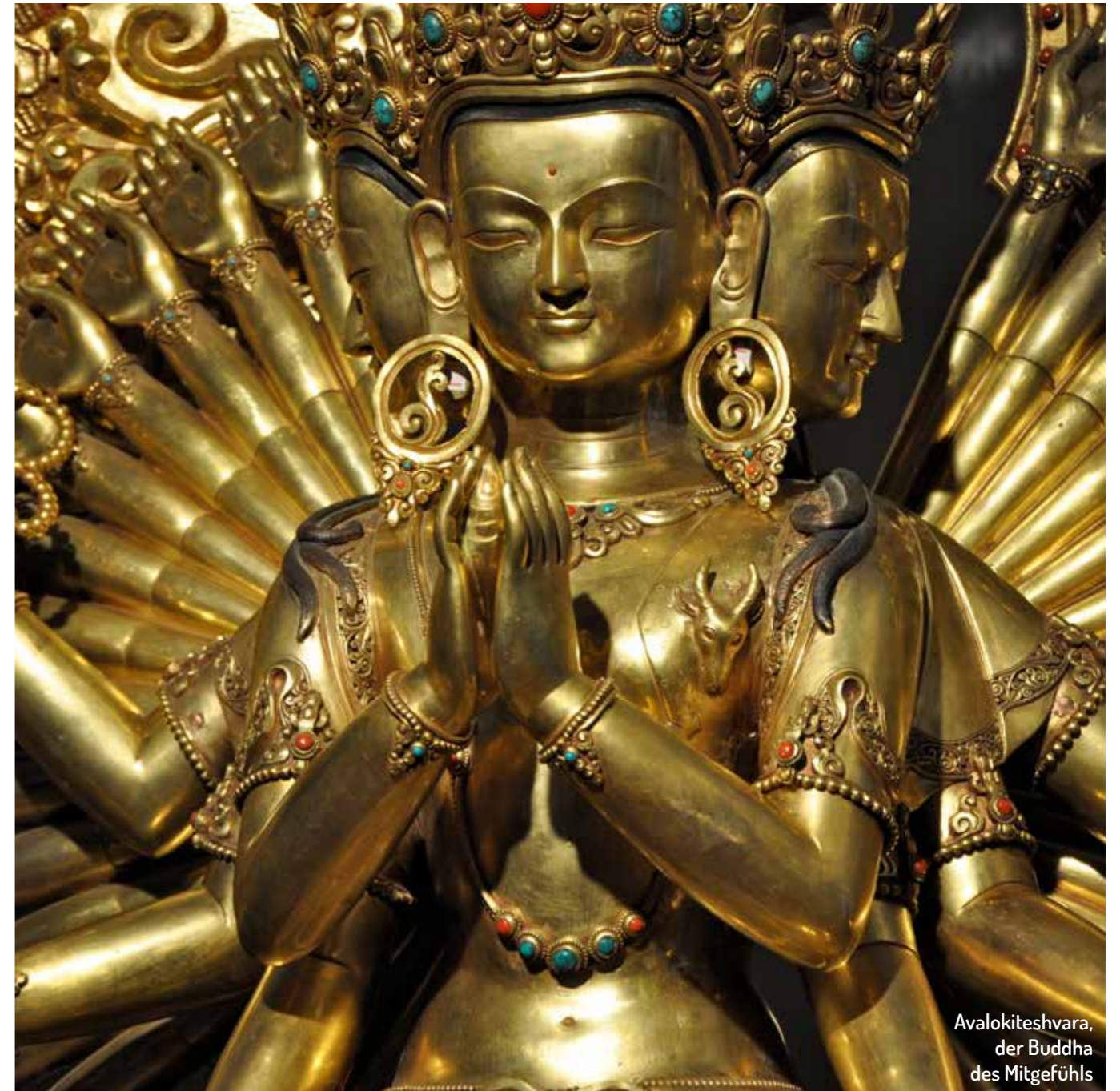
Avalokiteshvara, der Buddha des Mitgeföhls

Bewahrt alte Kulturen und Traditionen. Schützt das Weltkulturerbe. Erhaltet Baudenkmäler und Kunstschätze. Erlernt althergebrachtes Handwerk. Gebt Euer Wissen darüber weiter, seid Fürsprecher.