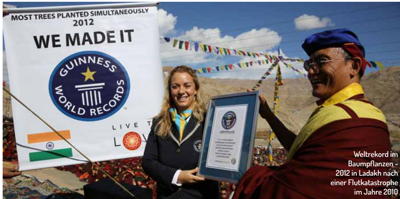
Weltrekord im Baumpflanzen - 2012 in Ladakh nach einer Flutkatastrophe im Jahre 2010