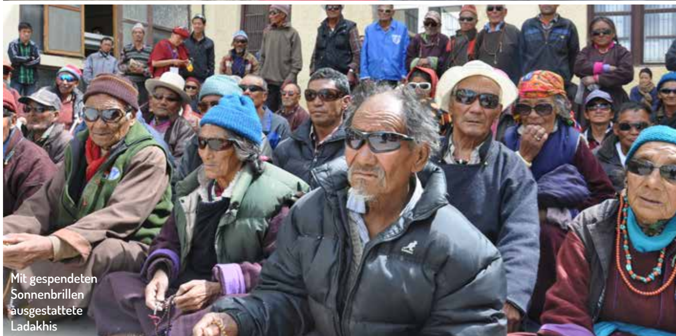
Mit gespendeten Sonnenbrillen ausgestattete Ladakhis